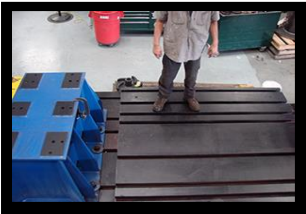
用克鏽轉化劑處理過的地板舉昇機