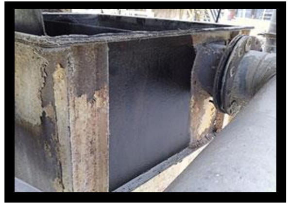
一位客戶發給我們的照片，使用克鏽轉化劑後，設備的部件被一層快速有效的塗層修復了。